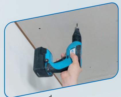
Für Decken und Bekleidung