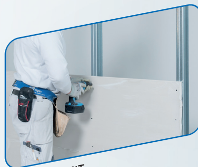
Für Wände MIT Unterkonstruktion