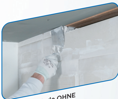
Für Massivwände OHNE Unterkonstruktion

Kurzum: Alles Alba® , alles Gute für Dein Zuhause!